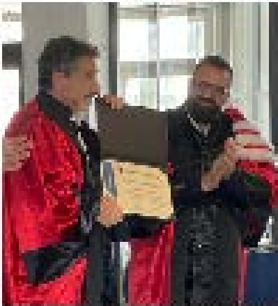
Salon des talents organisé par la maison de l'EM 14 novembre 2023