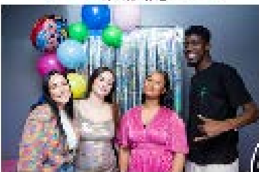
Salon des talents organisé par la maison de l'EM 14 novembre 2023