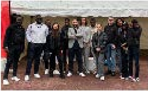
Week-end Vietnam 14 et 15 mai 2024