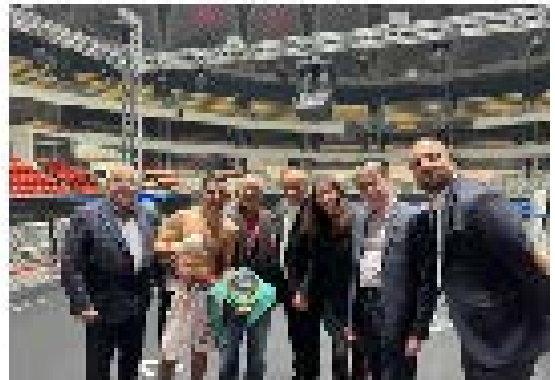
Intégration de la classe de 1ère Bac Pro en lycée professionnel 14 décembre 2023